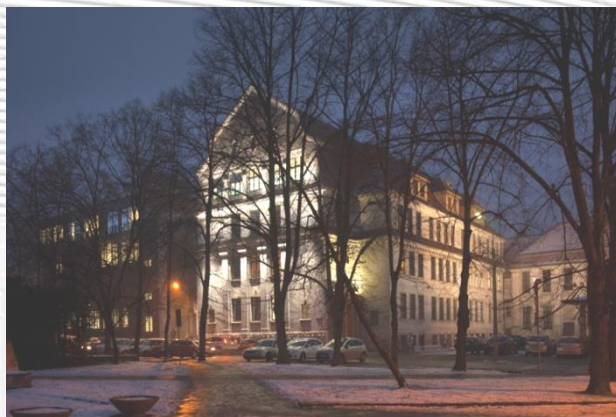
50 lat Wydziału Budownictwa i Architektury Politechniki Opolskiej

Artykuły nadesłane tylko w języku polskim, przyjęte przez Komitet Naukowy, mogą być zamieszczone w wybranym czasopiśmie naukowo-technicznym. Szczegóły przygotowania artykułu na stronie: https://ecce2018.po.opole.pl/