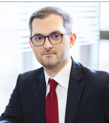
Marek Niedużak Wiceminister Rozwoju, Pracy i Technologii

Osoba wyznaczona na zarządcę sukcesyjnego musi wyrazić zgodę na objęcie funkcji. Gdy zarządcę sukcesyjnego powołuje przedsiębiorca, jego zgoda wymaga sporządzenia umowy pisemnej. Po śmierci przedsiębiorcy, zgoda zarządcy sukcesyjnego musi być wyrażona przed notariuszem.